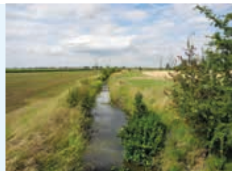
Gewässer mit Gewässerrandstreifen