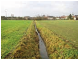
Gewässer ohne Gewässerrandstreifen