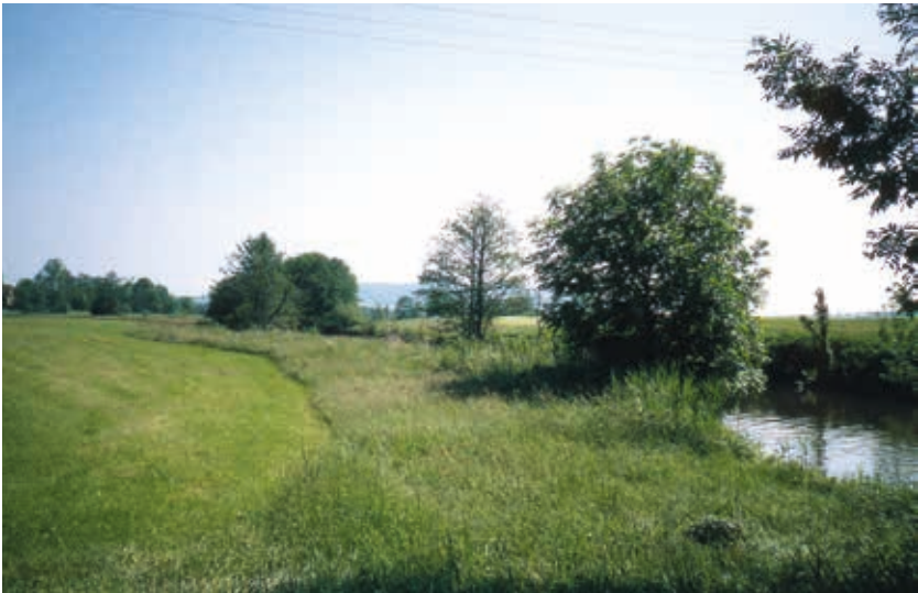
Gewässerrandstreifen mit Beschattung für das Gewässer

Für die einhergehenden Einschränkungen bisher zulässiger und tatsächlich ausgeübter Nutzungen aufgrund der gesetzlichen Vorgaben zum 5 Meter-Gewässerrandstreifen soll nach Maßgabe der verfügbaren Haushaltsmittel ein angemessener Geldausgleich gewährt werden. Die Grundlage für die Ausgleichszahlungen wurde bis Ende 2019 gemeinsam durch die Bayerischen Staatsministerien für Ernährung, Landwirtschaft und Forsten sowie Umwelt und Verbraucherschutz geschaffen. Die geplanten Ausgleichszahlungen sind beihilferelevant, weshalb ein EU-Notifizierungsverfahren erforderlich ist. Die Vorlage der Unterlagen bei der EU-Kommission erfolgte über das Bundesministerium für Ernährung und Landwirtschaft im Januar 2020. Erfahrungsgemäß ist für das Notifizierungsverfahren von Seiten der EU mindestens ein Jahr anzusetzen.