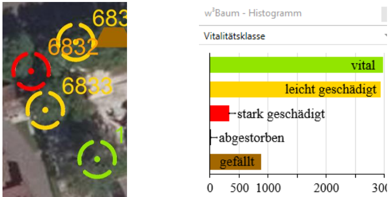
Auszug aus dem Baumkataster Lagemäßige Darstellung der Bäume mit Legende zur Vitalitätsklasse

Dabei wird Zustand der Bäume in den Farben Grün, Gelb und Rot angezeigt.