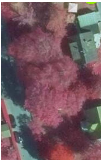
Bild links: Auszug aus einem Farbinfrarotluftbild

Mittlerweile enthält das Kataster ca. 8.000 Bäume und dient als Grundlage für die gemeindliche Baumkontrolle, erforderliche Pflegemaßnahmen sowie zur Beurteilung der Vitalität bei eingehenden Baumfällanträgen.