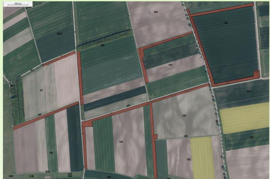
BLU2: Maßstab 1: 5.000