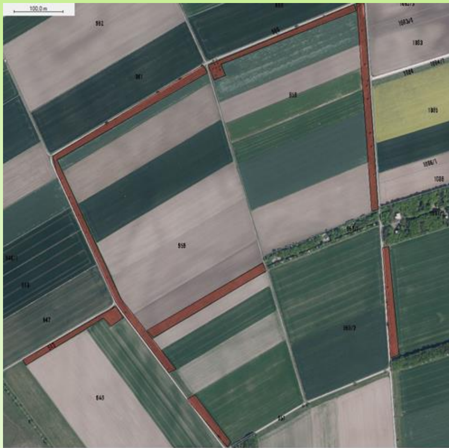
BLU3: Maßstab 1: 5.000